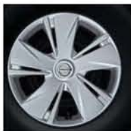
JANTE ACIER AVEC ENJOLIVEUR _ 14" DE SÉRIE SUR VERSION VISIA