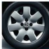
JANTE ALU _ 15" DE SÉRIE SUR VERSION ACENTA