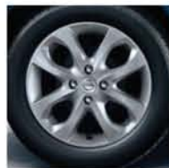
JANTE ALU _ 15" DE SÉRIE SUR VERSION TEKNA