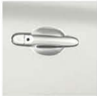
SOLID WHITE QM1