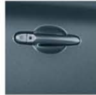
TUNGSTEN GREY FAA