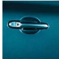
PACIFIC BLUE RBK