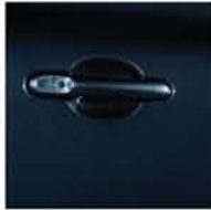
SAPPHIRE BLACK B20