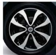
JANTE ALU _ 16" DE SÉRIE SUR VERSION N-TEC