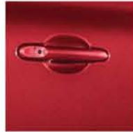
DARK RED AY4