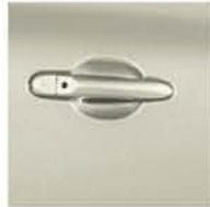
PEARLESCENT WHITE QX1