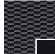
VISIA ET ACENTA BLACK