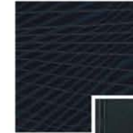
N-TEC_MODERN BLACK AND BLUE