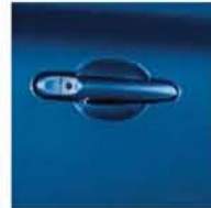
OCEAN BLUE B53